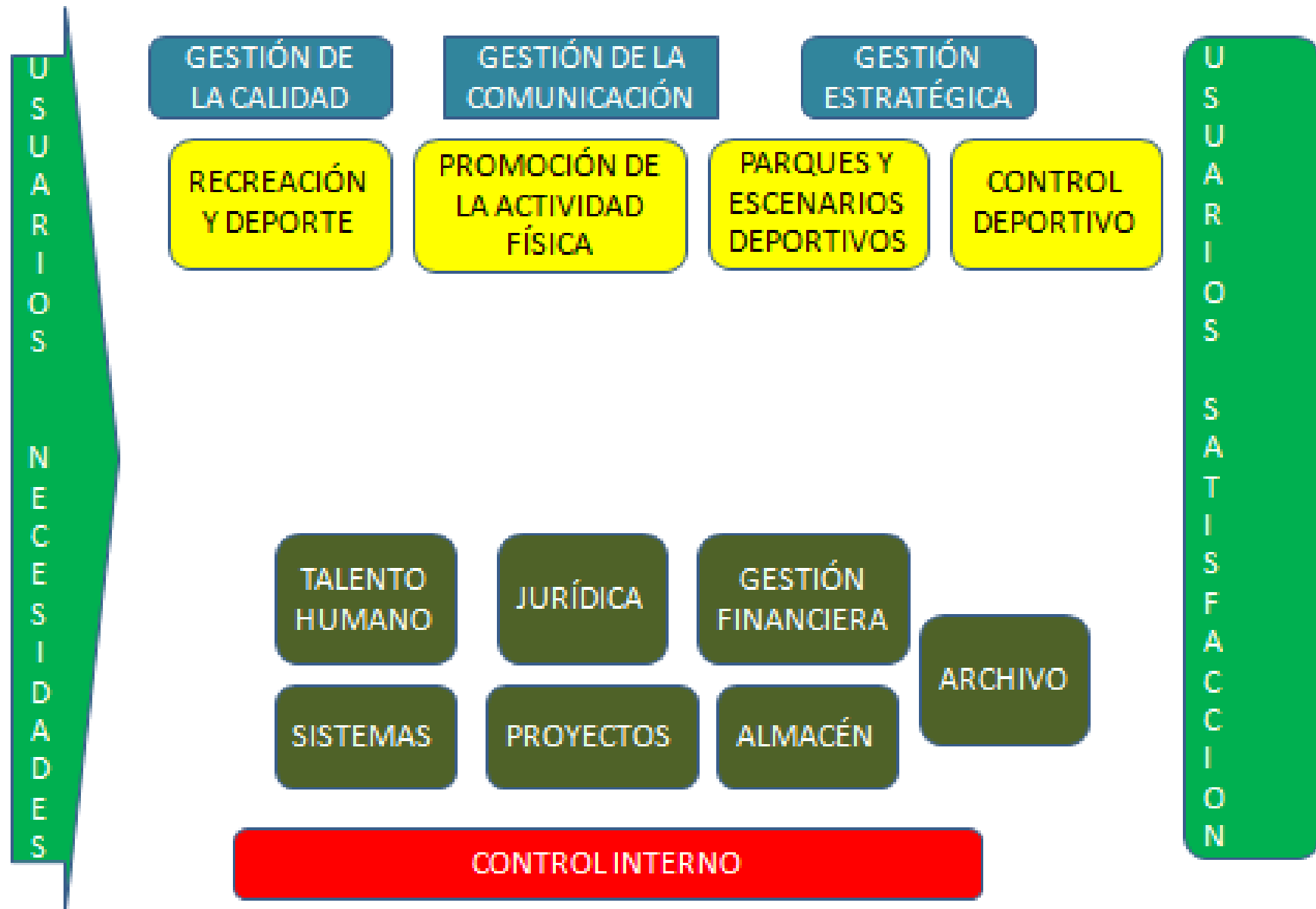
Ilustración 2. MAPA DE PROCESOS